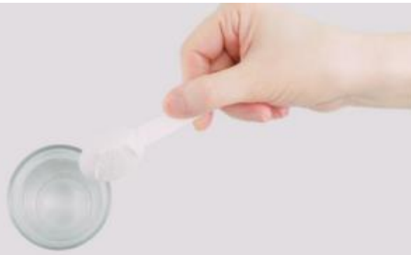
Схема приема детьми препарата Пикопреп перед колоноскопией

Для удобства дозирования препарата Пикопреп прилагается мерная ложка. При приготовлении раствора после заполнения мерной ложки рекомендуется провести плоским узким предметом по верхней части ложки. При этом в ложке остается 1/4 часть содержимого 1 саше (соответствует 4 г порошка).